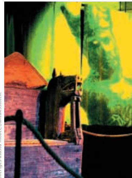
Sveriges äldsta möbel, Surtaksstolen.

LEKTÜRETIPPS: „Skara, del I“, Skara Historiekomité, und „Skara i medeltid“, Schrift Nr. 22 von Skaraborgs Länsmuseum.