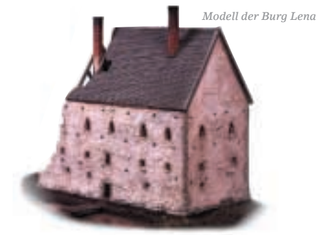
Modell der Burg Lena

An der Weggabelung steht ein origineller Wegweiser aus farbenfroh bemaltem Holz, Granne Påle genannt. Das Original von 1902 steht auf der Turbinenhausinsel in Tida-